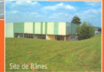
Site de Rânes